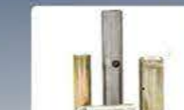
ос шенкелна knuckle axle