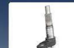
вал с шлици shaft with splene