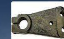
лост с шлицев отвор stotted lever