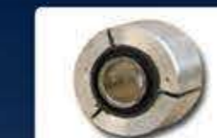
лагер сферичен еластичен bearing(sphere-elastic)