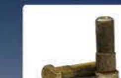
болт колесен bolt